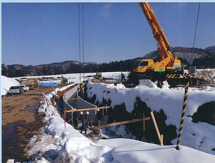
大型フリユーム布設の様子

平成24年度に実施しました第二田沢幹線用水路の改修工事は、仙北市白岩地区、大仙市惣行地区、美郷町黒沢地区で実施し、全て当初の計画通り完成することが出来ました。関係者の皆様には工事用地や工事車両の通行などご協力とご理解を頂きありがとうございました。